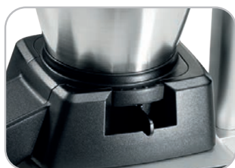
Leva per la regolazione dello spessore del ghiaccio Adjustable lever ice thickness